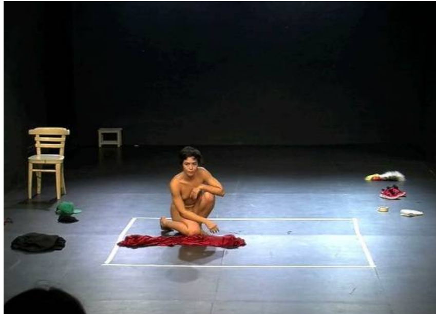
Microficciones (o cómo desaparecer en escena)

Un proyecto de Un solo trans- pasable: SKA/TCHAIKOVSKY