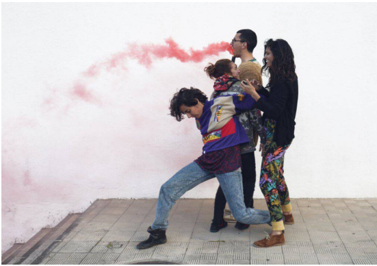
Taller de coreografía y efectos especiales

Como mediadora cultural desarrolla varios proyectos: