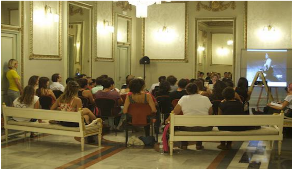
Encuentros sobre cuerpo y performatividad 2013.