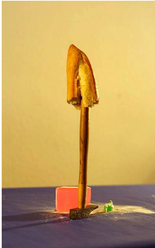
Equilibrio y otras coreografías 2012

Tenerife 1978. Estudia danza clásica y contemporánea en Canarias y cursa cuatro años de Historia del Arte en la Facultad de La Laguna antes de irse becada a Barcelona para la ampliación de su formación en Danza. Combina su trabajo como creadora con el estudio de Master en Gestión Cultural por Universidad Alcalá de Henares.